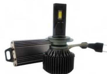
esempio in foto MOD 6957 (H7)